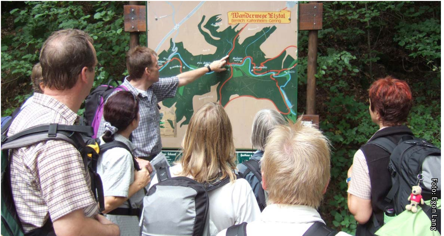
Wanderkarte im Großformat: Jeder weiß nun Bescheid, wo's richtig lang geht .....