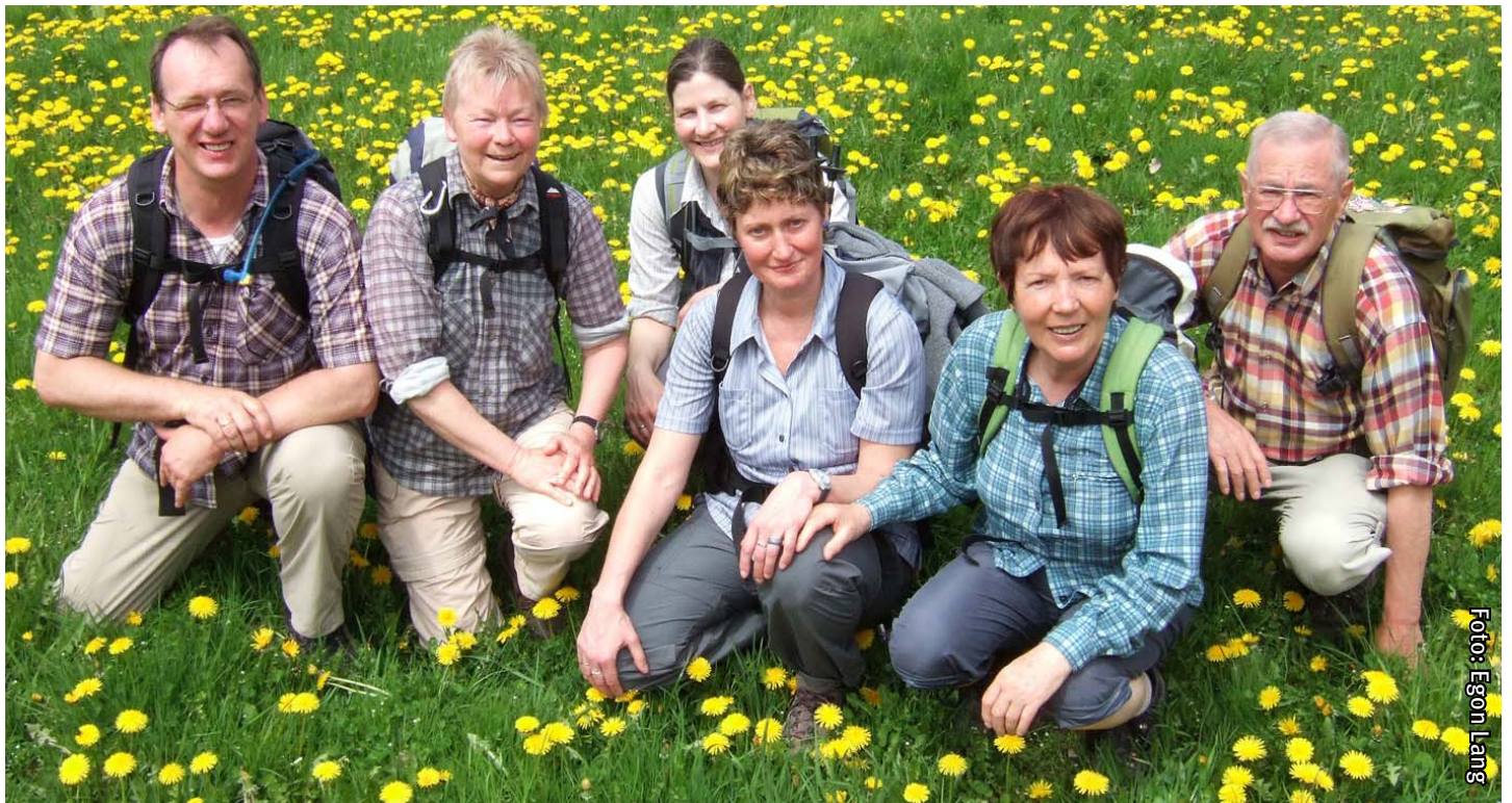
Auf der bunten Wiese: Fotoshooting mit Löwenzahn und Gänseblümchen