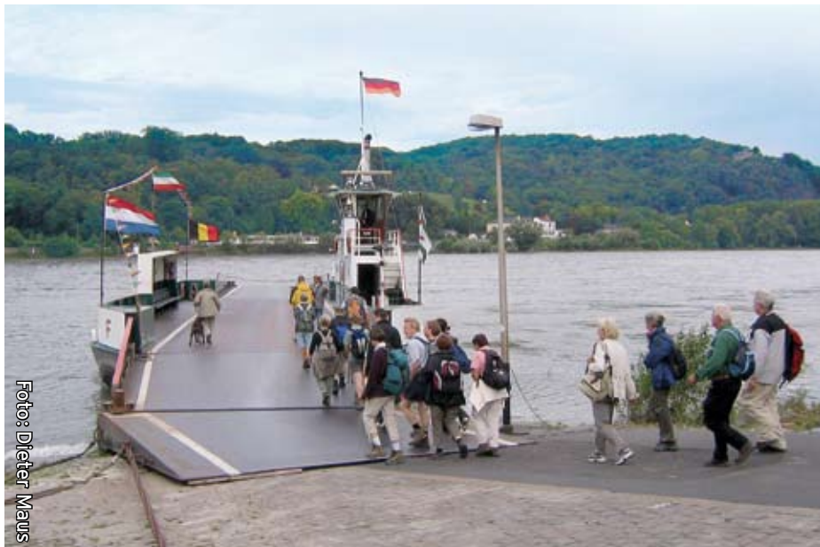
Auf zu neuen Ufern ...

- Wanderer sollten trittsicher und schwindelfrei sein. (Es besteht die Möglichkeit den Klettersteig zu umgehen) -